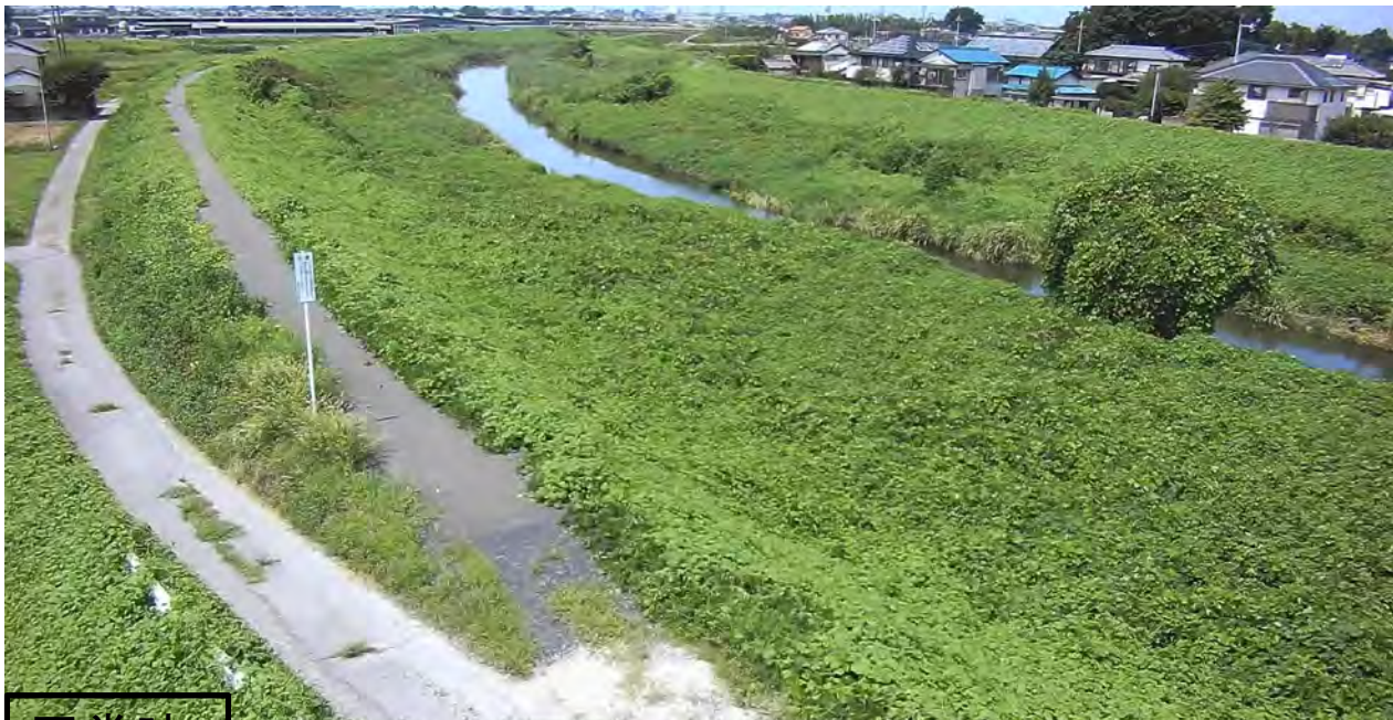
平常時 前島 (早川)