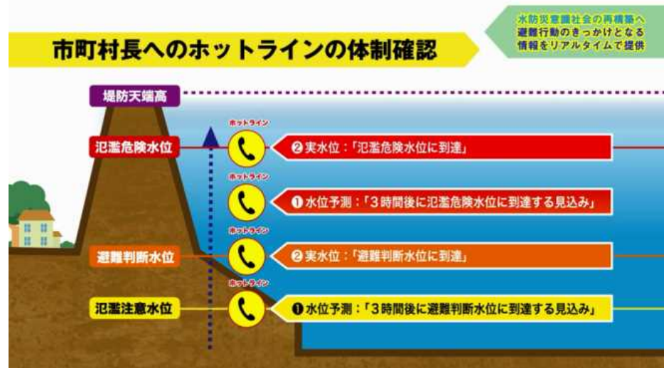
水害ホットラインのイメージ

「水防災意識社会再構築ビジョン紹介映像」(国土交通省) ( http://www.mlit.go.jp/river/mizubousaivision/ ) を加工して作成