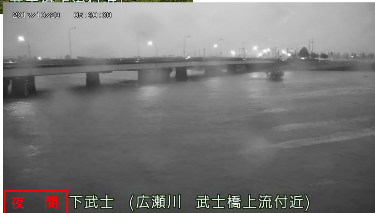
夜間 下武士 (広瀬川 武士橋上流付近)