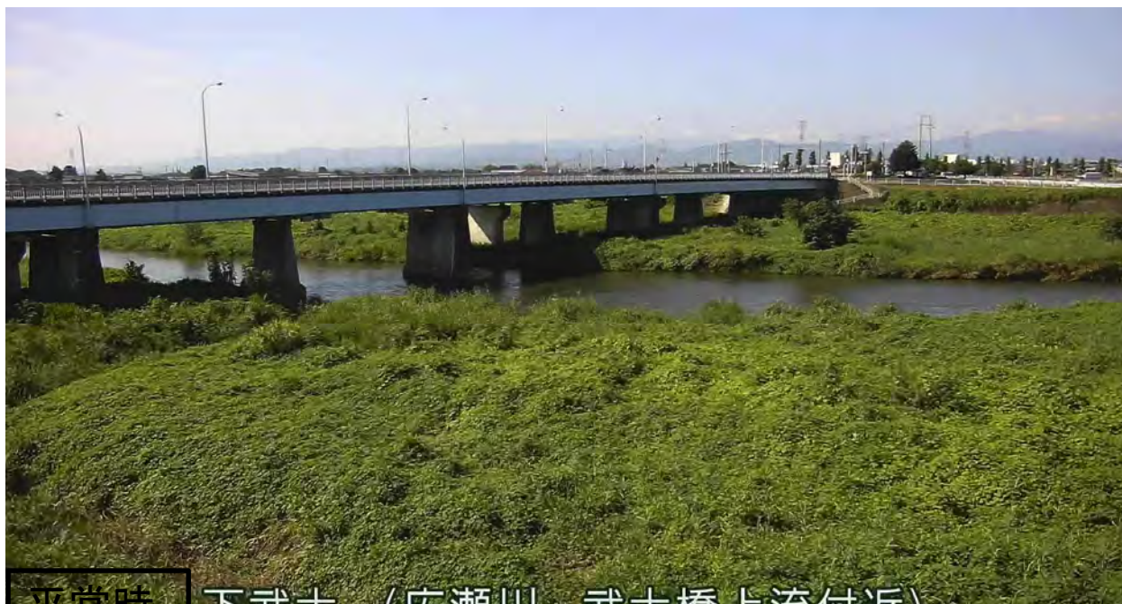
平常時 下武士 (広瀬川 武士橋上流付近)