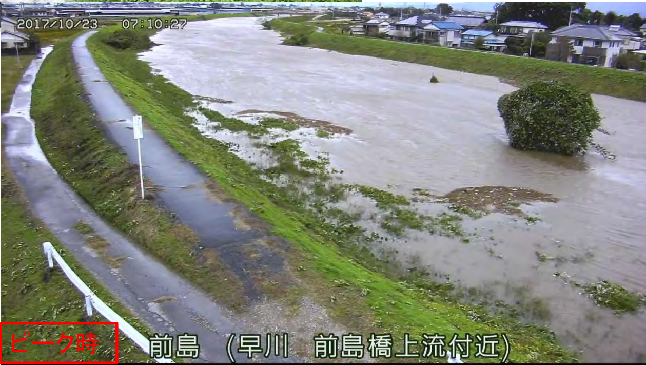
ピーク時 前島 (早川 前島橋上流付近)