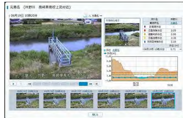
洪水監視カメラ・水位雨量情報システム（群馬県）